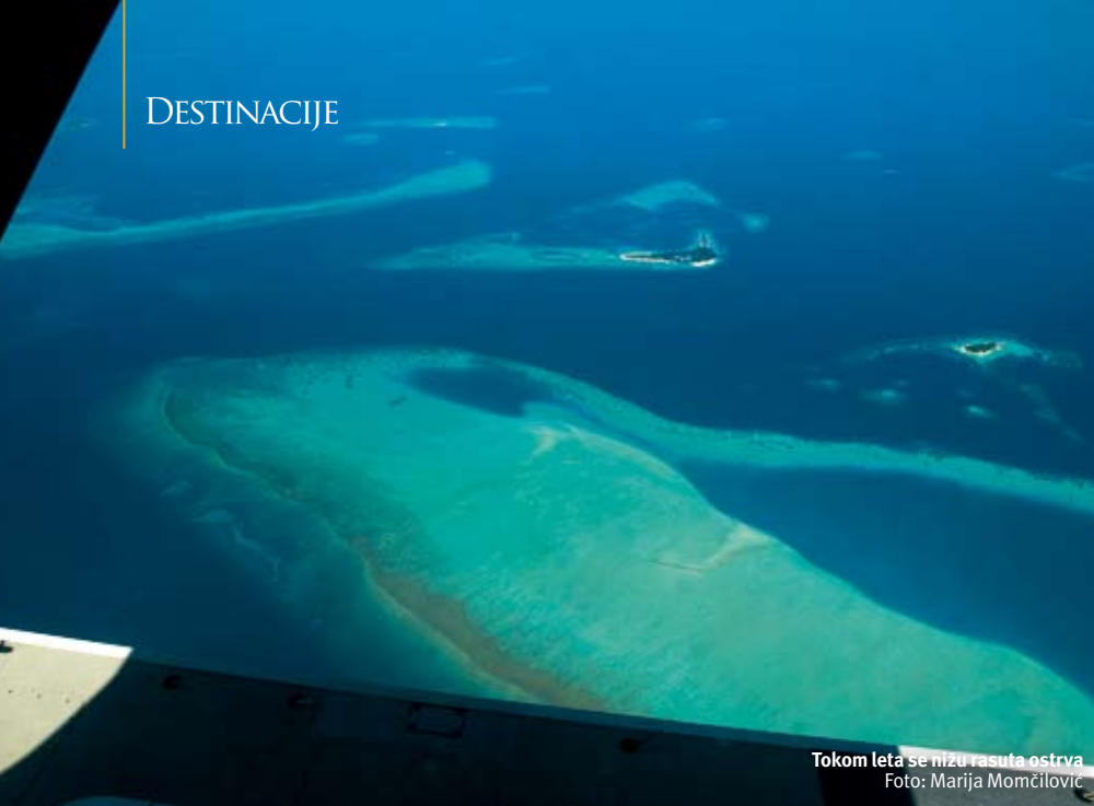
Tokom leta se nizu rasuta ostrva

Prostrana kupatila su sa pogledom na okean, unutrašnjim tušem i ogromnim đakuzijem na sredini. Tu je, naravno, i tuš pod vedrim nebom, ako tokom kupanja želite da osetite miris mora i blagi povetarac na licu. Staza koja vodi do njega je od kamenčića među kojima se nalazi osvetljenje, tako da uveče deluje da hodate po užarenom kamenju.