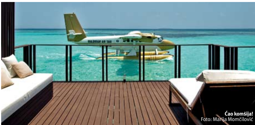
Čao komšija!

da vidimo kako će izgledati naš "dom" na Maldivima. U sobi su nas čekali sveže voće i voda, veliki izbor čajeva, kao i aparat za Nespresso. Sve što je potrebno kako bismo ujutru, na terasi, uz šum mora i šoljicu kafe mogli da započnemo jedan novi, savršen dan... A kada dan ovako počne, sve obećava da može još prijatnije i da se završi. Zavirili smo u frižider