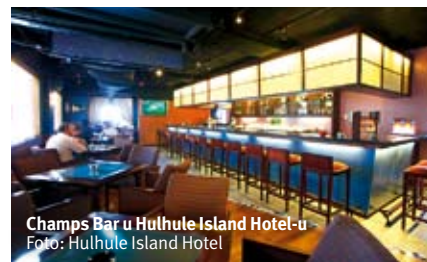
Champs Bar u Hulhule Island Hotel-u