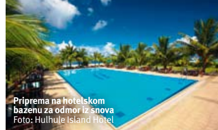
Priprema na hotelskom bazenu za odmor iz snova