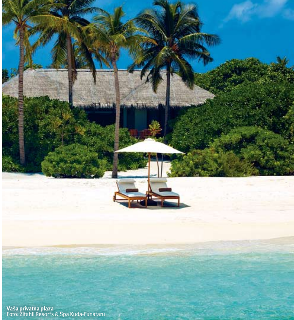
Vaša privatna plaža