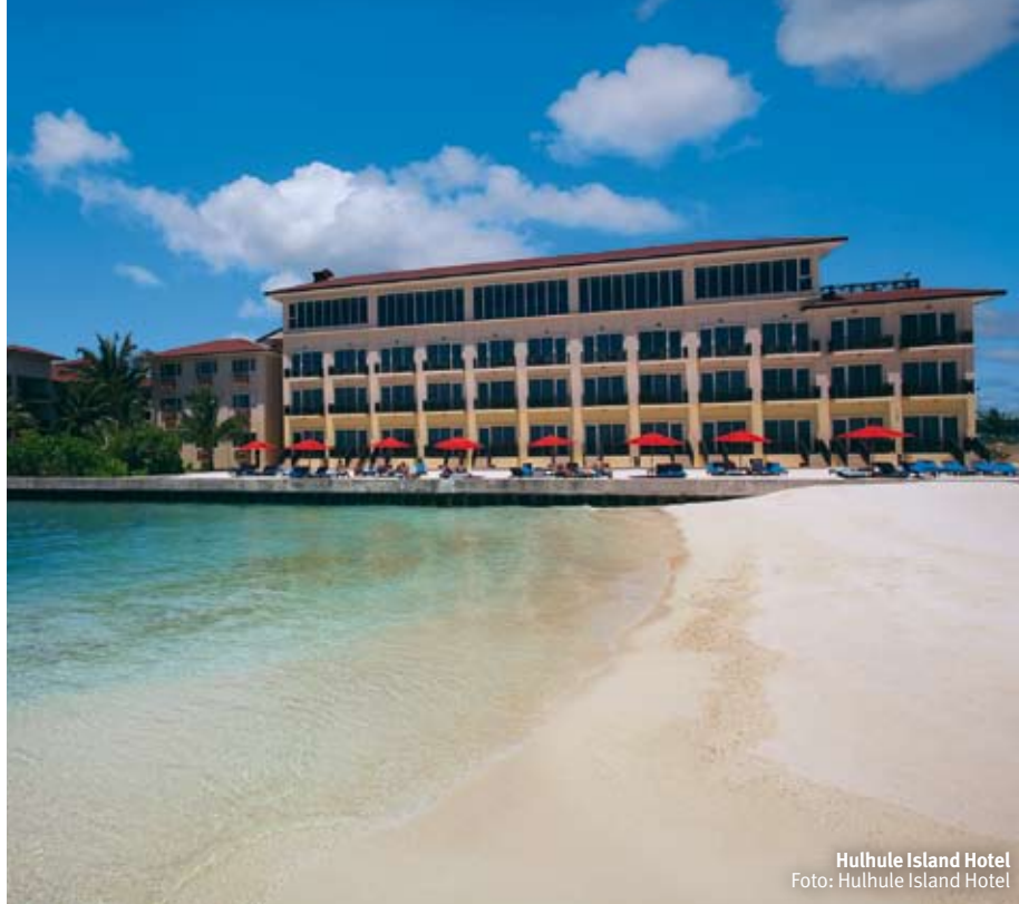
Hulhule Island Hotel