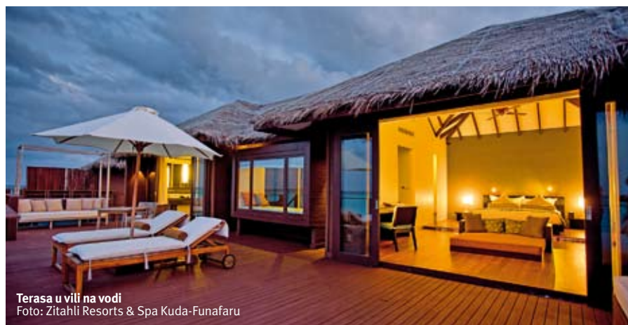
Terasa u vili na vodi

U ovom velnes centru, možete da se opustite uz prvoklasnu indonežansku ili balinežansku masažu, kao i brojne druge tretmane. Parovi imaju posebnu pogodnost da dobiju zajednički tretman i masažu - odnosno uživaju u privilegiji da se ne razdvajaju, jer je sve podređeno romantično i zajedničkom uživanju.