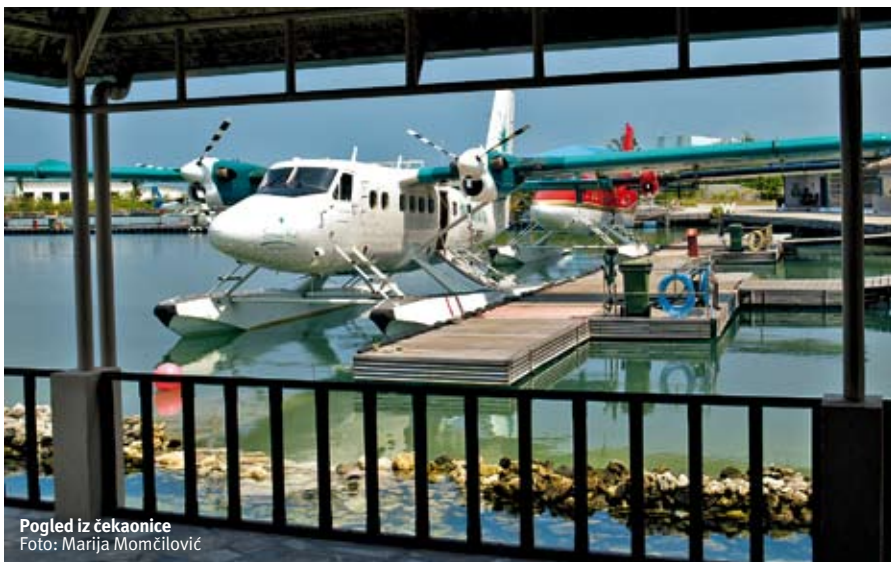
Pogled iz čekaonice

mesta. Ovaj avio prevoznik počeo je sa radom 1993. godine sa dva hidroaviona. Danas ih u floti ima ukupno 24, a godišnje preveze preko 40.000 putnika.