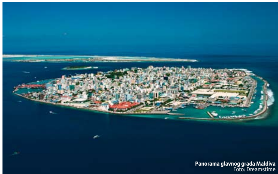
Panorama glavnog grada Maldiva

Ukoliko prenoćite u ovom hotelu, možete posetiti Male, glavni grad Maldiva, koji je od hotela udaljen svega 10 minuta vožnje brodićem. To je prilika da se upoznate sa njegovom istorijom, političkim i društvenim uređenjem i da osetite život u "velikom" gradu, što svakako nije uobičajen prizor u ovoj ostrvskoj zemlji. Kako bi vam odlazak u Male bio što jednostavniji, Hulhule Island Hotel svojim gostima pruža besplatnu uslugu prevoza!