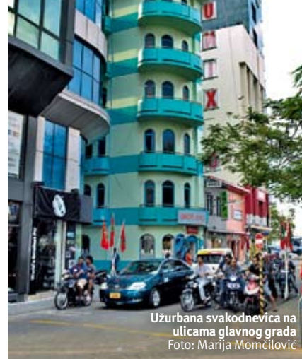
Užurbana svakodnevica na ulicama glavnog grada