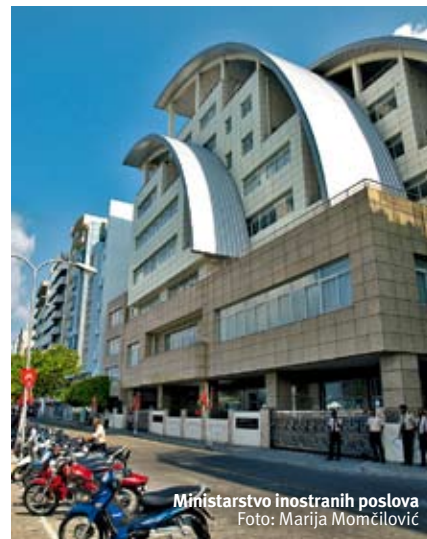
Ministarstvo inostranih poslova