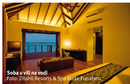
Soba u vili na vodi