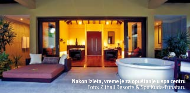
Nakon izleta, vreme je za opuštanje u spa centru