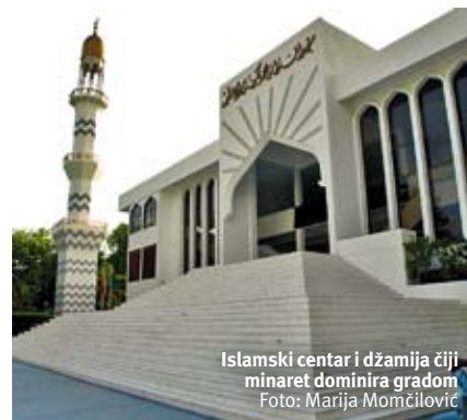
Islamski centar i džamija čiji minaret dominira gradom

žene. Nekoliko blokova dalje, ka unutrašnjosti ostrva, nalazi se istorijski centar Malea. U blizini mauzoleja jednog od prvih islamskih prosvetitelja iz 12. veka (Medhuziyaaraay), najstarije džamije i velikog minareta (Munnaru), nalazi se i predsednička rezidencija (Mulee-aage). Prepoznatljiva je po belom zidu koji je okružuje i stubovima ukrašenim šarenim mozaikom. Ako provirite kroz ogradu, videćete da je sama kuća još živopisnija od zida, sa krovom pastelno roze boje.