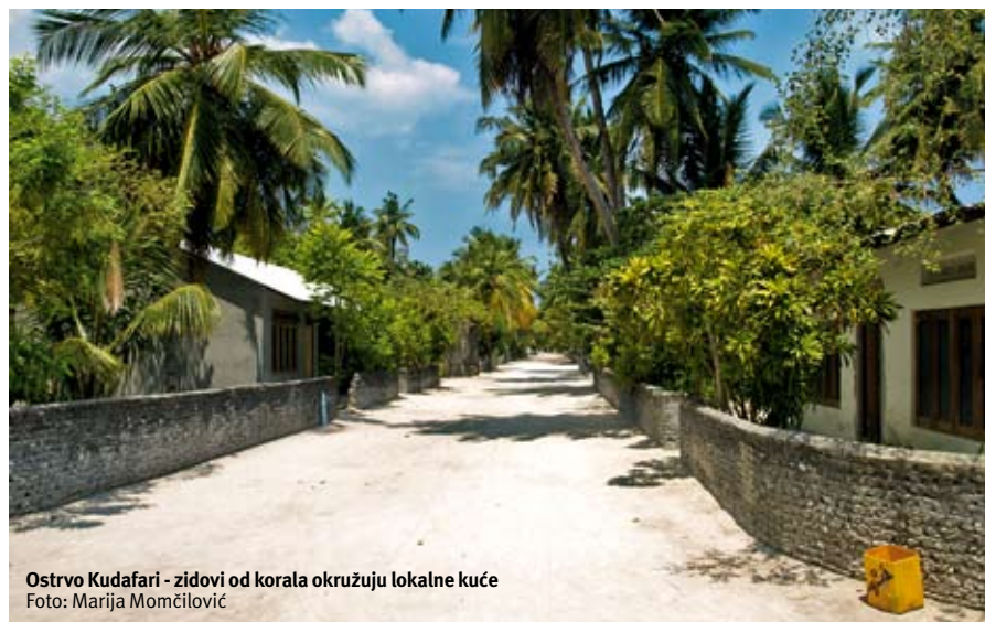
Ostrvo Kudafari - zidovi od korala okružuju lokalne kuće

Ako imate želju da nešto pročitate, slušate muziku, pogledate koncert ili film, u Zitahli-ju postoji biblioteka sa velikim izborom knjiga, muzičkih diskova i filmova. Za dodatne trenutke uživanja na raspolaganju vam je i Zitahli Spa.