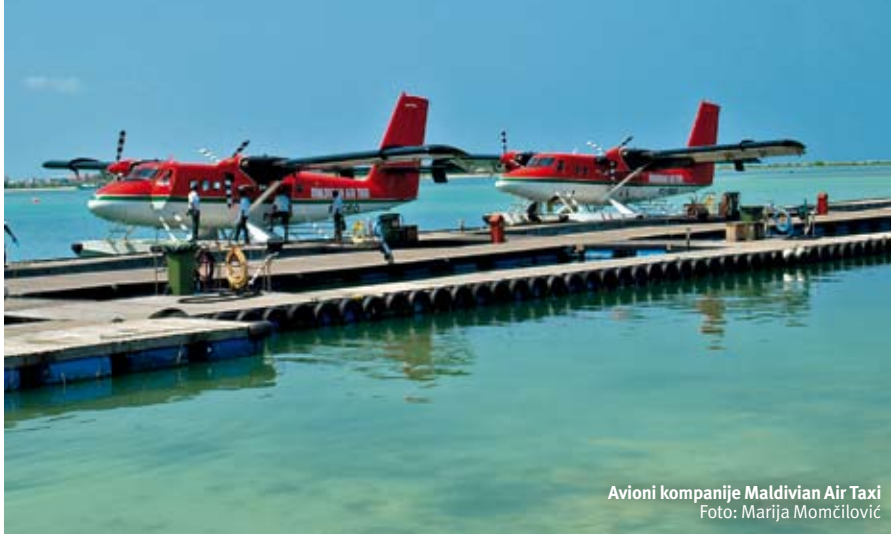
Avioni kompanije Maldivian Air Taxi