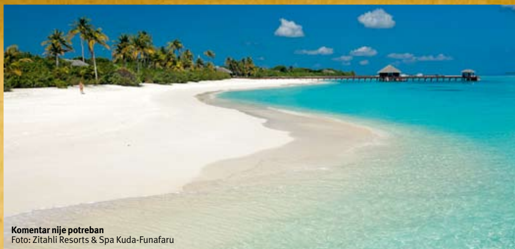
Komentar nije potreban

Maldivi imaju tropsku klimu , tako da je cele godine toplo i sunčano, sa temperaturama vazduha između 25 i