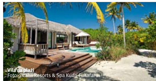
Vila na plaži