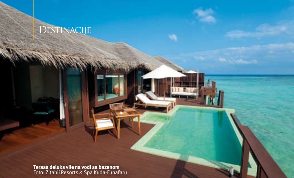
Terasa deluks vile na vodi sa bazenom