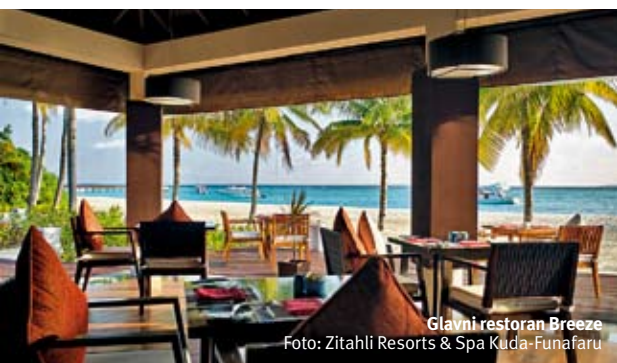
Glavni restoran Breeze