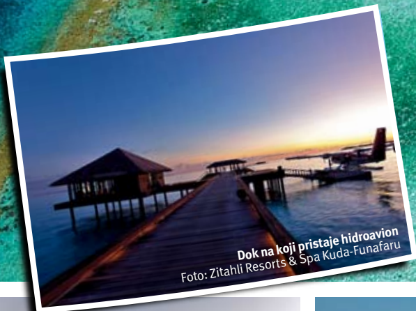
Dok na koji pristaje hidroavion