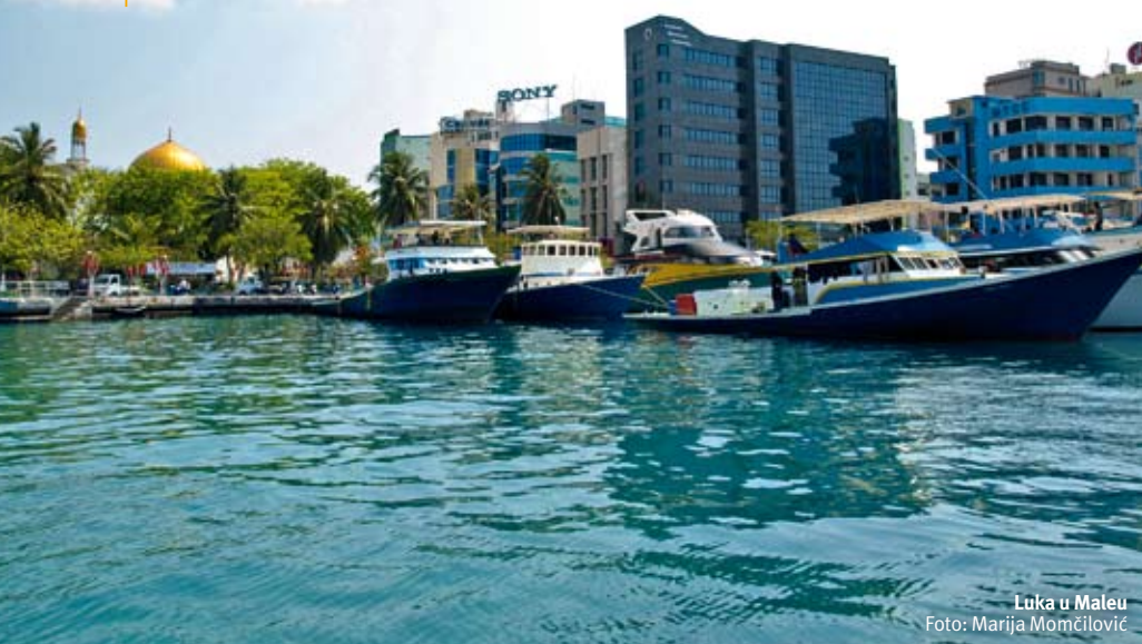
Luka u Maleu