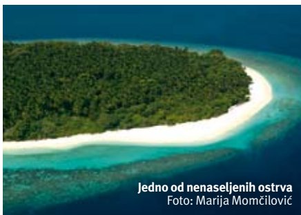
Jedno od nenaseljenih ostrva

Sa druge strane ostrva, nalazi se netaknuti koralni greben, koji je pravi raj za ronioce, jer se na jednom mestu može videti čitavo bogatstvo podvodnog sveta Indijskog okeana. Dok smo jednog popodneva uživali u istraživanju morskog dna, pored brojnih tropskih ribica pridružile su nam se i bebe ajkule. Bilo nam je zanimljivo da se igramo sa njima, samo smo se nadali nam se u igri neće pridružiti i njihova mama! Što se ronjenja tiče, na samo pola sata od ostrva nalazi se nekoliko vrhunskih ronilačkih destinacija, koje možete posetiti u organizaciji ronilačkog centra iz čuvenog lanca Werner Lau, lociranog u rizortu. Ako pak niste ronilac ili hoćete da napravite predah, a volite "plovidbu", možete iznajmiti gliser i obilaziti okolna ostrva ili se oprobati u jedrenju na dasci, surfu, katamaranu, dnevnim ili noćnom pecanju. Na raspolaganju su vam i krstarenje sa delfinima u smiraj dana ili noćno krstarenje na mesečini, ali samo ako je