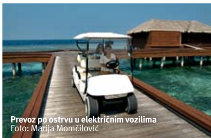
Prevoz po ostrvu u električnim vozilima