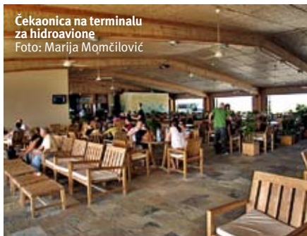
Čekaonica na terminalu za hidroavione