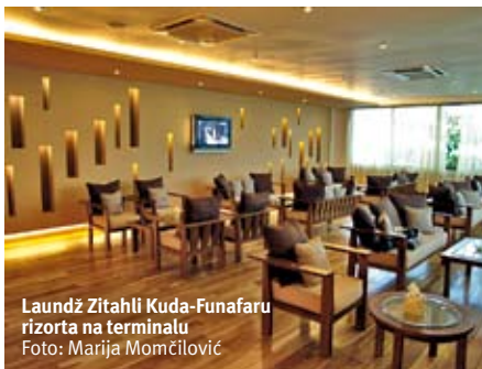
Laundž Zitahli Kuda-Funafaru rizorta na terminalu