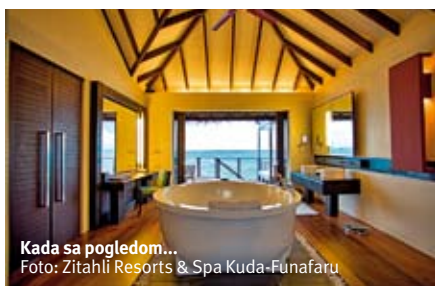
Kada sa pogledom...