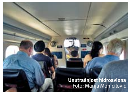
Unutrašnjost hidroaviona