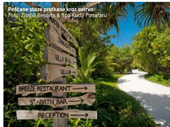
Pešane staze protkane kroz ostrvo

pun mesec! Ako ste raspoloženi za neki sport, tu je teniski teren, kao i savremeni i potpuno opremljen fitness centar.