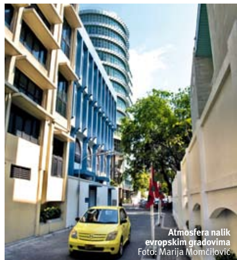
Atmosfera nalik evropskim gradovima