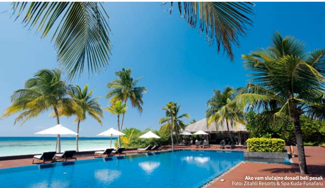
Ako vam slučajno dosadi beli pesak

zaposlenih, a osoblje je ljubazno, uvek nasmejjano i diskretno se trudi da vas upozna i u svemu zadovolji. Renomirani italijanski kuvar tokom večere izlazi da vas pozdravi i poželi vam ugodno veče. Jednom nedeljno menadžment hotela organizuje koktel pored bazena, koji za cilj ima zblizavanje sa gostima, druženje, časkanje i uživanje u prvoklasnoj hrani. Kada krenete sa ostrva, činiće vam se da za sobom ostavljate drage i iskrene prijatelje.