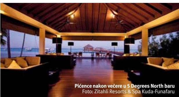
Pićence nakon večere u 5 Degrees North baru