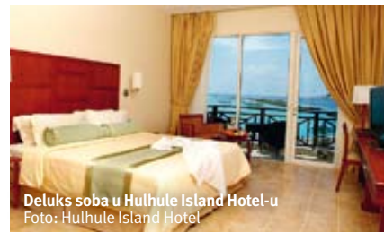
Deluks soba u Hulhule Island Hotel-u

skih hotela, a bio je finalista i 2009. godine. U sobama viših kategorija možete imati sopstveni balkon i čakuzi, LCD televizor i DVD plejer, kao i mnoge druge pogodnosti.