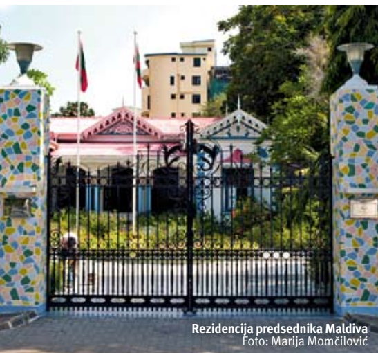
Rezidencija predsjednika Maldiva