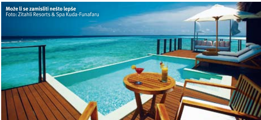
Može li se zamisliti nešto lepše